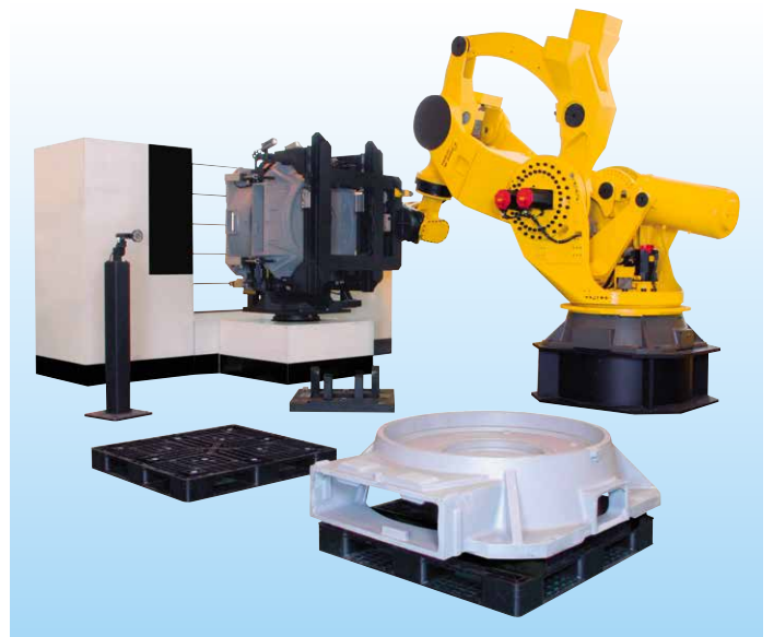
使用M-2000iA/1200把大型铸件装上机械加工用夹具