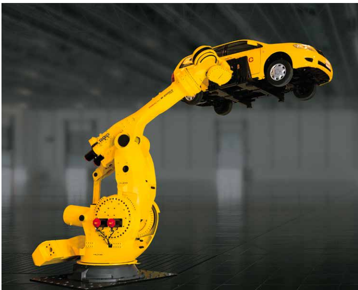
使用M-2000iA/1700L搬运完成车体