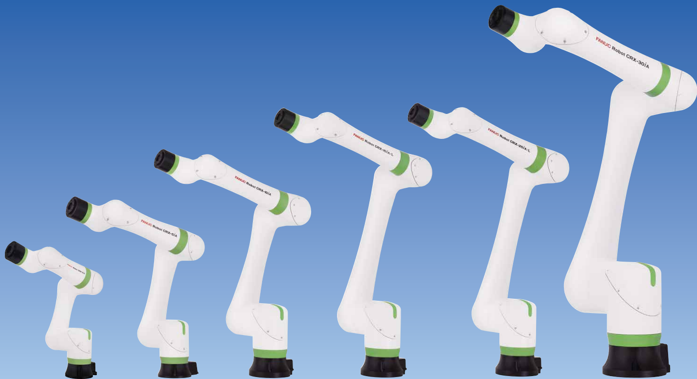
CRX-3iA CRX-5iA CRX-10iA CRX-10iA/L CRX-20iA/L CRX-30iA