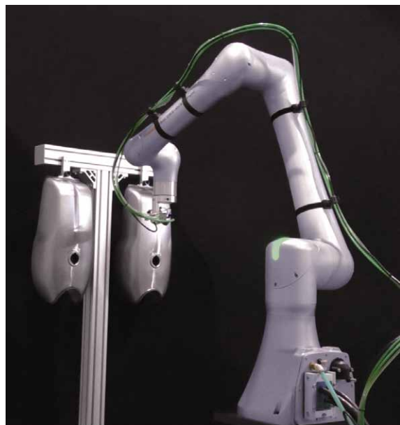
ガソリントankの塗装