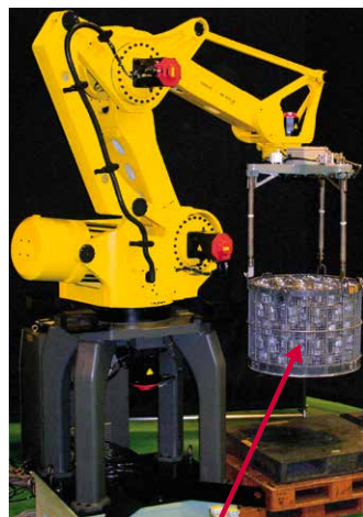
重量ワークの搬送