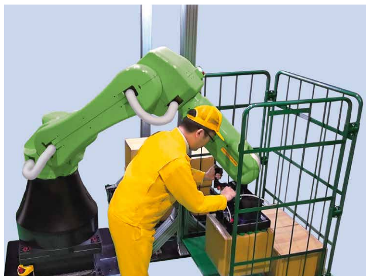
ハンドガイドを使った部品搬送