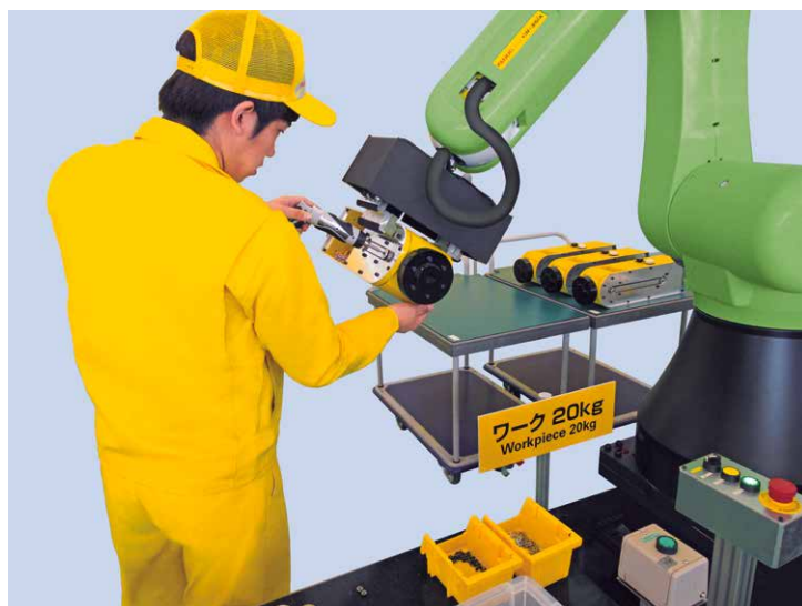
協働作業による部品組立