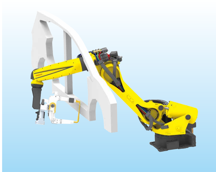
高速スポット溶接